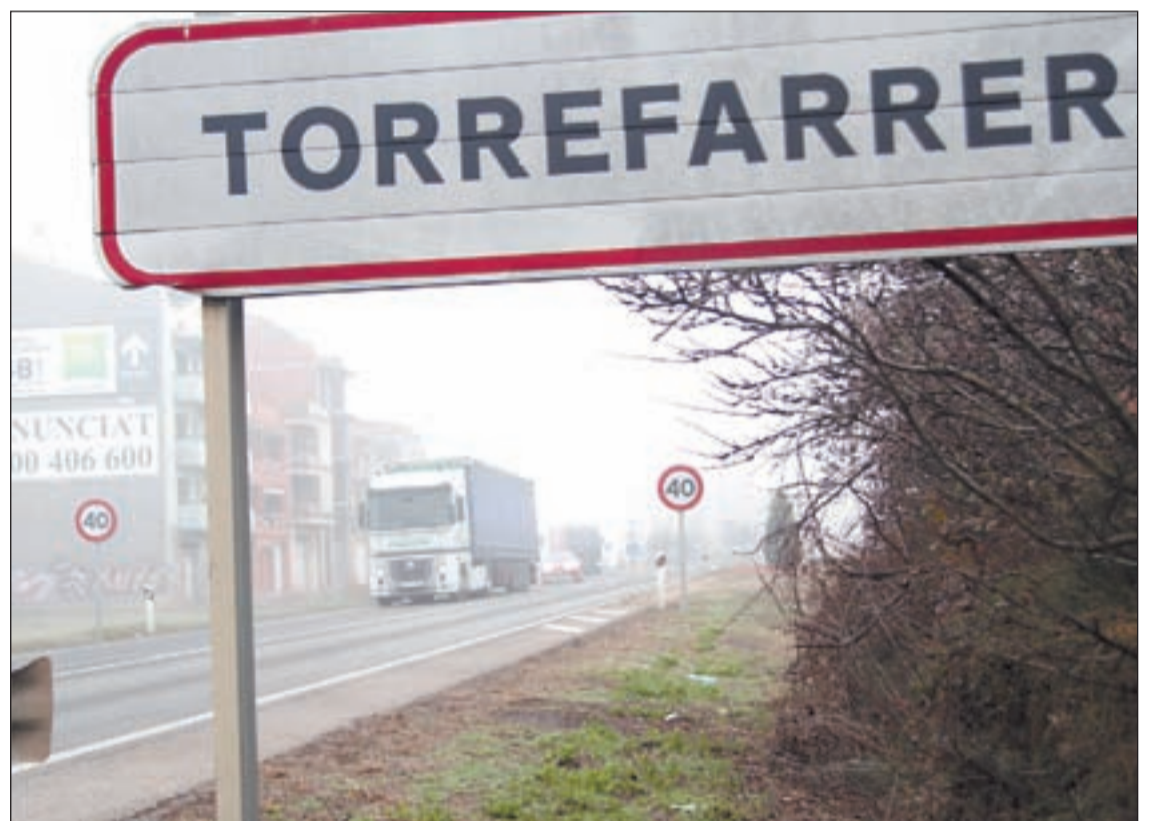
Camions transitant ahir al matí per la N-230 al seu pas per Torrefarrera

Perea va recordar que quan el Ministeri de Foment va presentar el projecte d'aquest tram d'autovia ja hi va marcar entre els termes d'Alguaire i Almenar una àrea de servei, si bé finalment es va desestimar ja que el lloc on es contemplava era una zona d'especial protecció d'aus (ZEPA) i els informes de Medi Ambient ho van rebutjar. L'alcalde d'Alguaire va indicar ahir el trànsit que absorbeix el tram d'autovia entre Lleida i Almenar cada cop és major, si bé va reconèixer que encara hi ha camions que transiten per