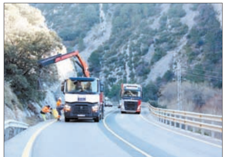
Els operaris realitzant ahir tasques de preparació

var, segons va explicar l'alcalde d'Organyà, Cel·lestí Vilà. Les afectacions en el trànsit es produiran entre les vuit del matí i les sis de la tarda de dilluns a dijous laborables i de vuit del matí a tres de la tarda els divendres. L'objectiu és minimitzar-ne l'impacte tenint en compte que la via suporta un elevat volum de vehicles, sobretot en cap de setmana. L'alcalde d'Organyà va explicar que les restriccions no s'allargaran durant tota aquesta franja horària, sinó que la majoria seran per ocupar, en diversos moments del dia, un o dos carrils de la carretera uns deu o quinze minuts.